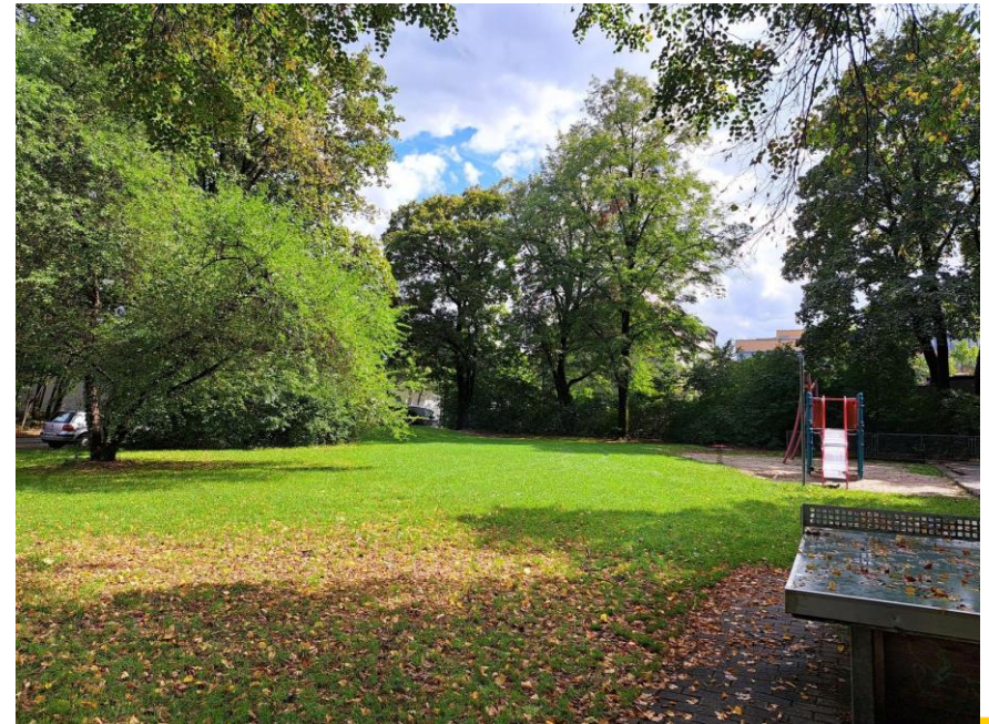
Spielplatz an der Paulsdorfferstraße